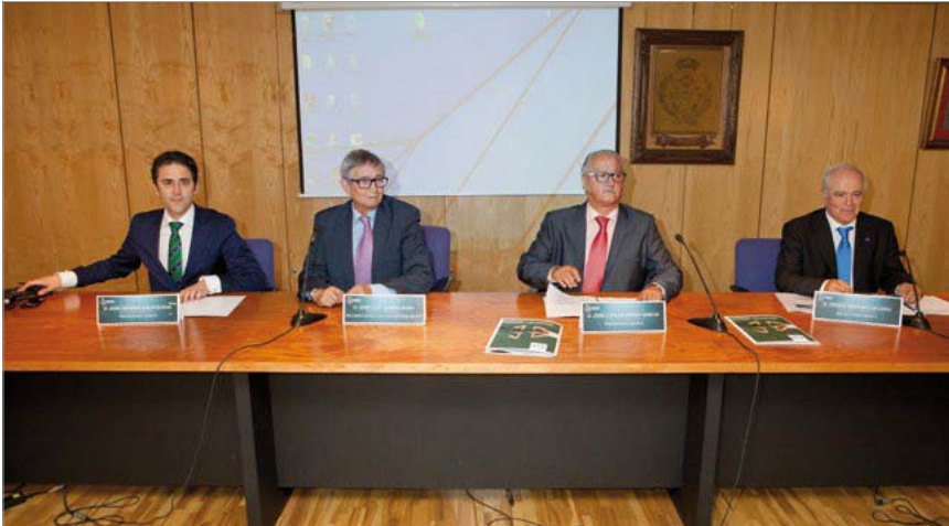
Mesa de Presidencia de la Asamblea.