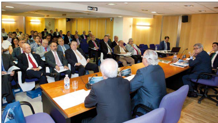
Panorámica de los asistentes a la Asamblea General

Expresó su satisfacción por los resultados alcanzados en el ejercicio 2014, que definió como “un año de duro trabajo para conseguir un resultado muy satisfactorio”.